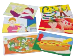
中学校英語ピクチャーカード 8-314-4007 動詞 税込 ¥15,540 8-314-4008 形容詞 税込 ¥15,540 8-314-4009 食べ物・飲み物 税込 ¥15,540