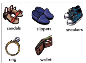
ピクチャーカード