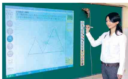
インタラクティブユニットeB-P+e 黒板アシスタント 7-177-1011 | V2セット 税込 ¥141,540