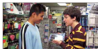
英語学習のための国際理解 ～授業を活性化する資料映像～全9巻(ビデオ) 8-310-4180 税込 ¥179,550