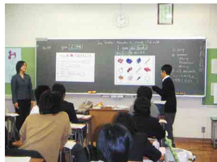
生徒を指名して前に出させ、拡大機で作成したピクチャーカードを使って会話練習しているところ