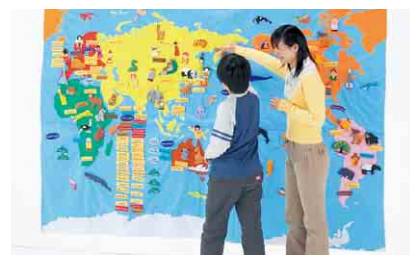
ジャイアント ワールドマップ 8-360-4104 | フェルトモチーフ181ピース付 税込 ¥60,900