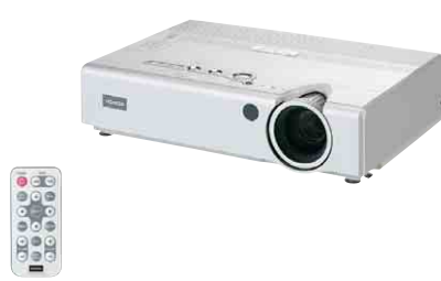
黒板モードプロジェクター 7-127-2104 | TG-3000K オープン価格