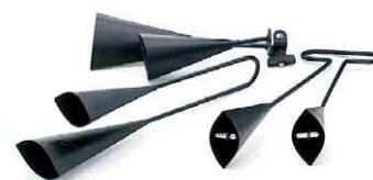
アゴゴ・ベル 4581970 税込 ¥4,725