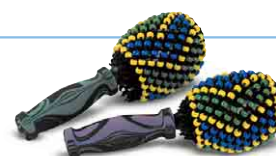
マラカス 4775100 税込 ¥2,835