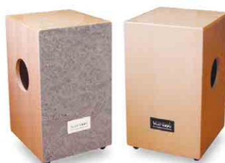
カホン 4775960 税込 ¥36,750