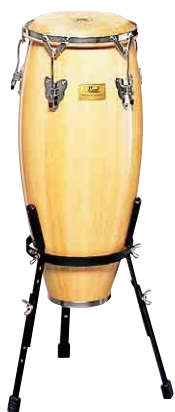
コンガ 4553011 税込 ¥45,150