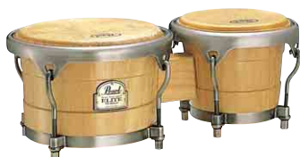
ボンゴ 4553150 税込 ¥31,500