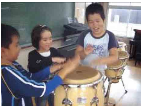
どんな音になるか楽器に初めて触れているところ。