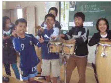
グループでいろいろな楽器を組み合わせて演奏しているところ。