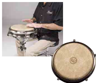
トラベルコンガ 4552230 税込 ¥24,150