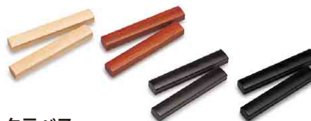
クラベス 4771170 税込 ¥1,050