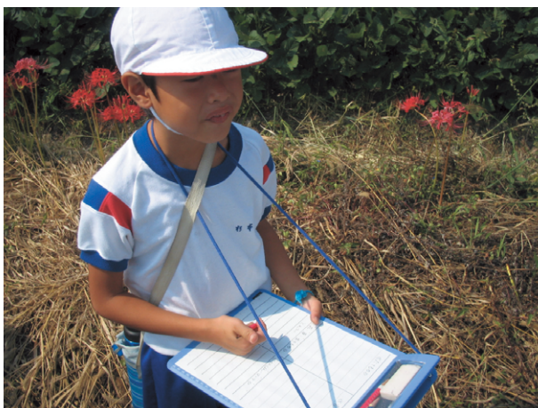
探検・観察ボードを使っているところ