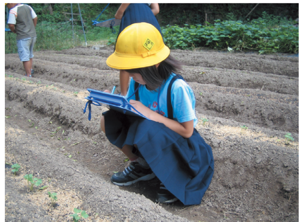
探検・観察ボードを使っているところ