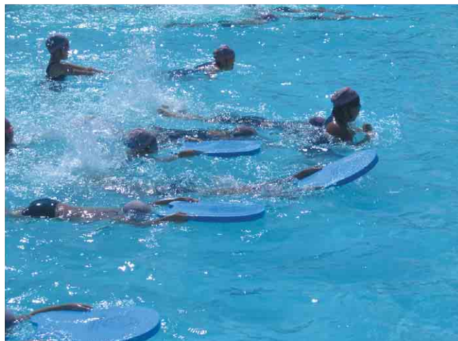
スイムボードを使い浮いている様子。 パタ足で泳いでいる児童もいる。